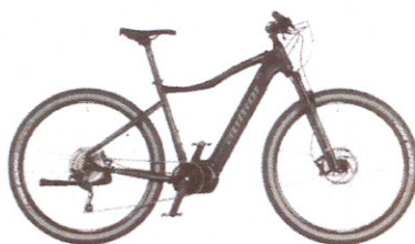
ELEVATION 29 2020